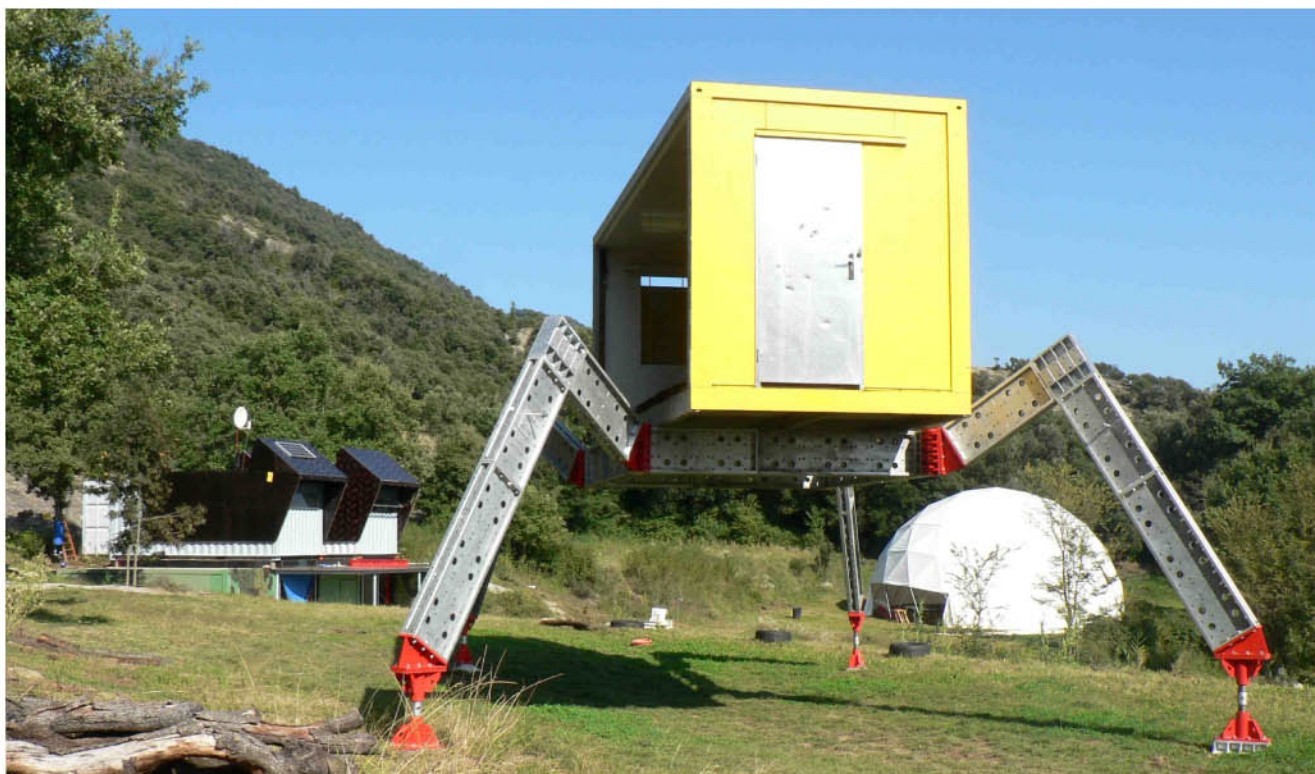
En la foto los prototipos que se montaron para el encuentro de Torelló: la araña, nautarquía y la cúpula geodésica