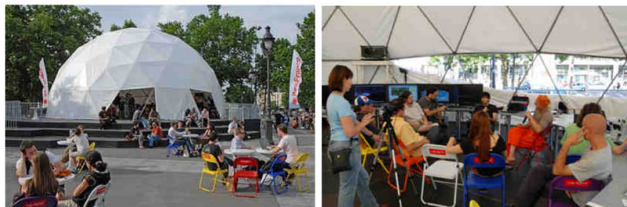
La Wikiplaza en la Plaza de la Bastilla en París

La Wikiplaza es una propuesta de construcción y significación de la ciudad híbrida a través del espacio público, generando un espacio público complejo como resultante de la interacción del espacio físico tradicional y el espacio digital.