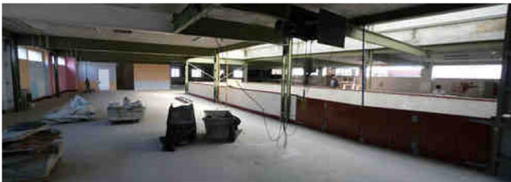
Estado actual de Ciriza