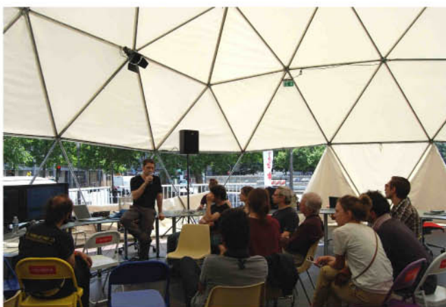
Arriba presentaciones en Aula Abierta y el prototipo Cacharro 2.0 de Cáceres y un taller de Arduino en la Wikiplaza